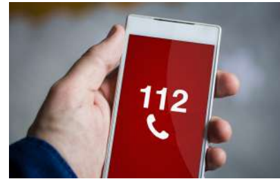
Llamar por teléfono al 112.