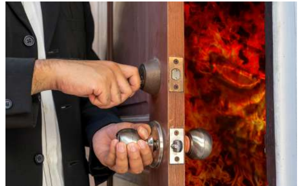
Cerrar la puerta.